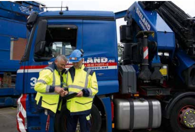
Die Online-Applikation im Einsatz bei der Firma Gustav Seeland in Hamburg.

derem auf Smartphones, Tablets und anderen mobilen Endgeräten anzeigen.