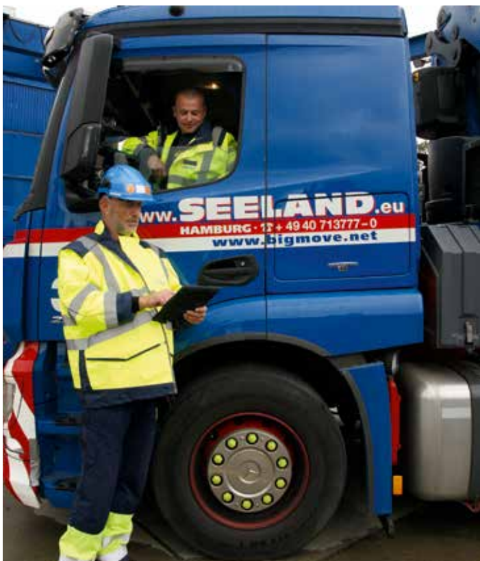
Der Fahrauftrag kann an der Lade- und Entladestelle digital unterschrieben werden.